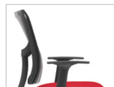
Oscilação da costa em 11°.