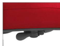
Regulação de altura por elevação a gás.