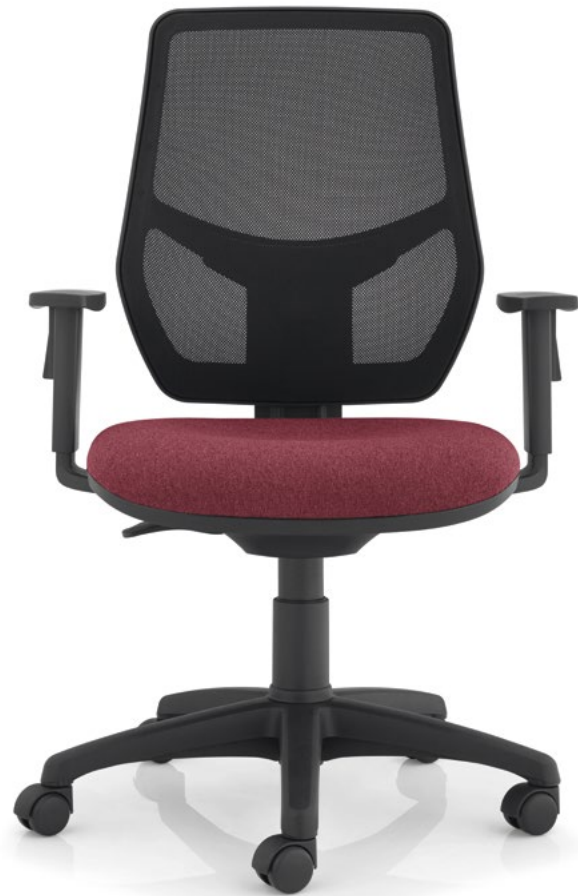
35.2212.PR c/ 35.BRPP