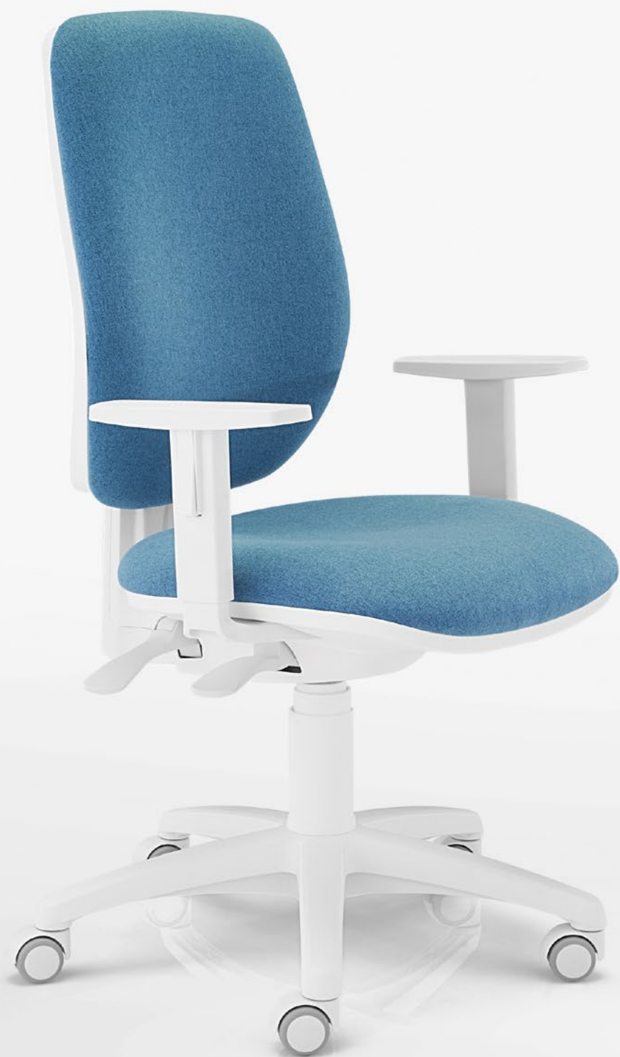
35.2212.PO.02 c/ 35.BRPP.02