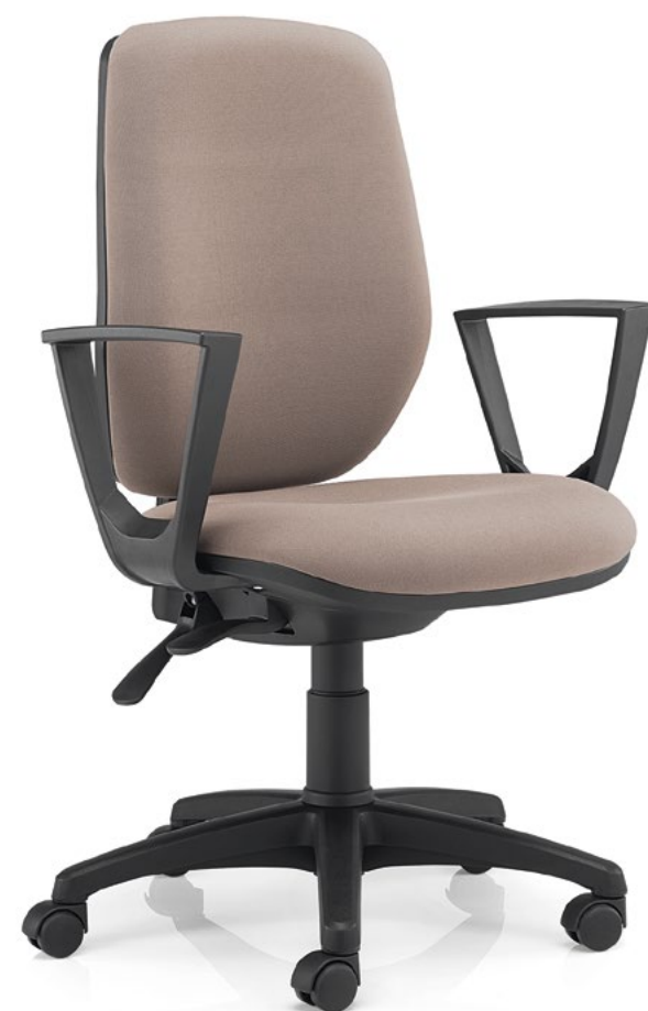
35.2211.PO c/ GM.BFPP